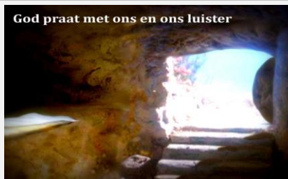
God praat met ons en ons luister

Het jy geweet? Die produksiekoste van die Bybel in Braille beloop vandag ongeveer R3200, maar die Bybelgenootskap, met die hulp van donateurs, maak dit moontlik vir blindes om 'n volledige Braillebybel gratis te bekom.